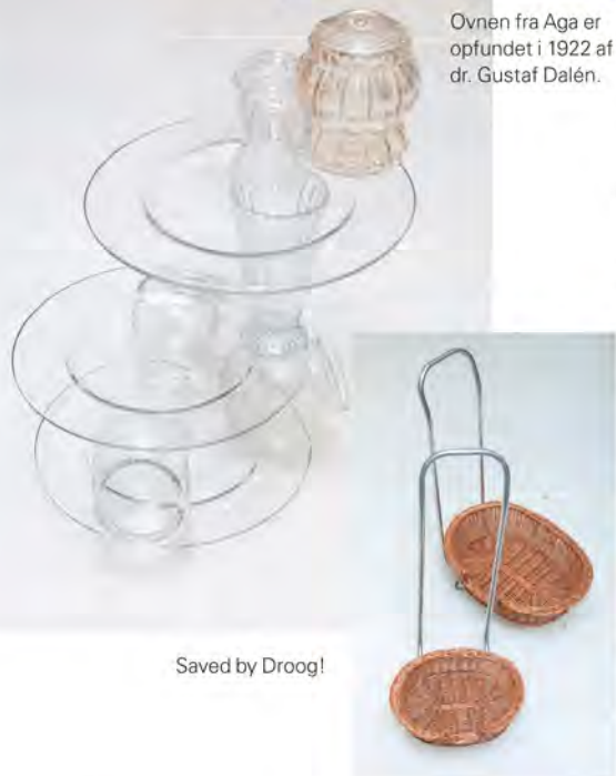
Saved by Droog!

– Jeg har aldrig været optaget af trenden for trendens skyld, men er mere optaget af historien bag ved en genstand. At skabe sig et hjem er jo ikke et projekt, men en proces, som i mit tilfælde altid har været en inspirerende rejse. Lige fra dengang jeg gik på designskole, har jeg købt genbrug og elsket at overtage ting, som andre ikke kunne bruge mere. Det er vel blevet en livsstil, og derfor har næsten alt i mit hjem en historie. Men jeg har altid haft en svaghed for god belysning og kunst – og det er her, jeg har brugt mit budget.