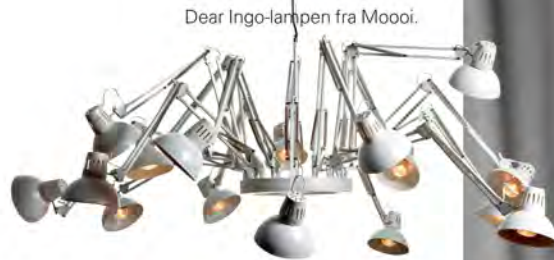
Dear Ingo-lampen fra Moooi.

HVORDAN FÅR VI LYST TIL AT BO OG INDRETTE OS? HVOR VIL VI GERNE REJSE HEN? OG HVAD BLIVER HOT I DESIGN – OG KUNSTVERDENEN I DET NYE ÅR? SE, HVAD FIRE TRENDSÆTTERE TROR PÅ.