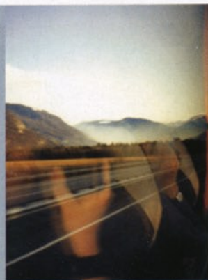
"On the move"- eller "To go"-produkter er helt uundværlige i speed-livsstilen og -kulturen.

Vi spotter i øjeblikket to hovedkategorier af mennesker: The Hunter/jægeren og The Gather/samleren. Her ser vi på en af jægertyperne, nemlig Speed Hunteren. Han fører en ekstremt aktiv tilværelse, og hverdagen udnyttes til det yderste for at få det optimale ud af livet. Han elsker stimulerende og udfordrende aktiviteter, både professionelt og i fritiden. Han har to prioriteter: Time Zone, hvor hans fokus er tiden, og Recovery Zone, hvor der oplades til endnu en dag på farten i rekreative pit-stop, hvor han genoplader kroppen og sjælen. Intelligente, tidsbesparende løsninger forfører hans utålmodige natur – og han sigter konstant mod toppen og eliten.