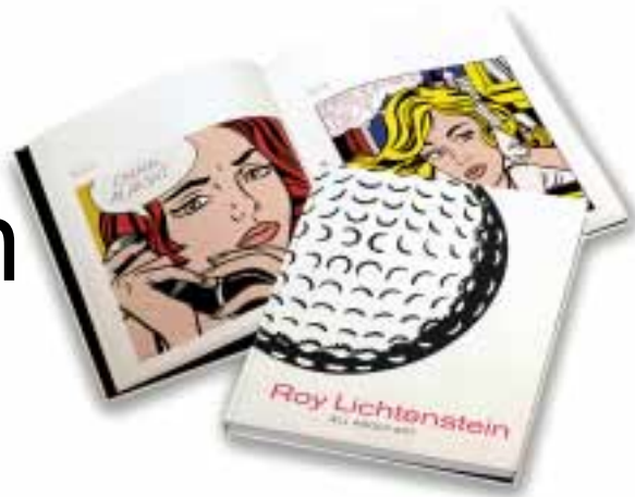
Roy Lichtenstein – All about Art.

Den amerikanske maler Roy Lichtenstein hører til blandt de kunstnere, der relativt sent finder deres kreative udtryk og får deres kommercielle gennembrud. Lichtenstein nærmede sig de 40 år, inden hans værker omkring 1961 begyndte at få den form, som han havde søgt, siden han var teenager. Herefter var der til gengæld ingen rysten på hånden, hverken hos kunstneren selv eller hos kunderne. På et halvår lavede han mindst 30 malerier og 16 tegninger – og køberne stod i kø.